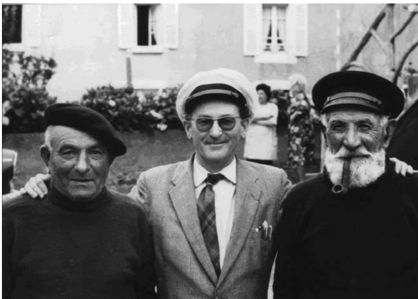
Lan o vousec'hoarzin, asamblez gand daou besketaer... heb na vefe dizoñjet e gravatenn a vro-Skos ...