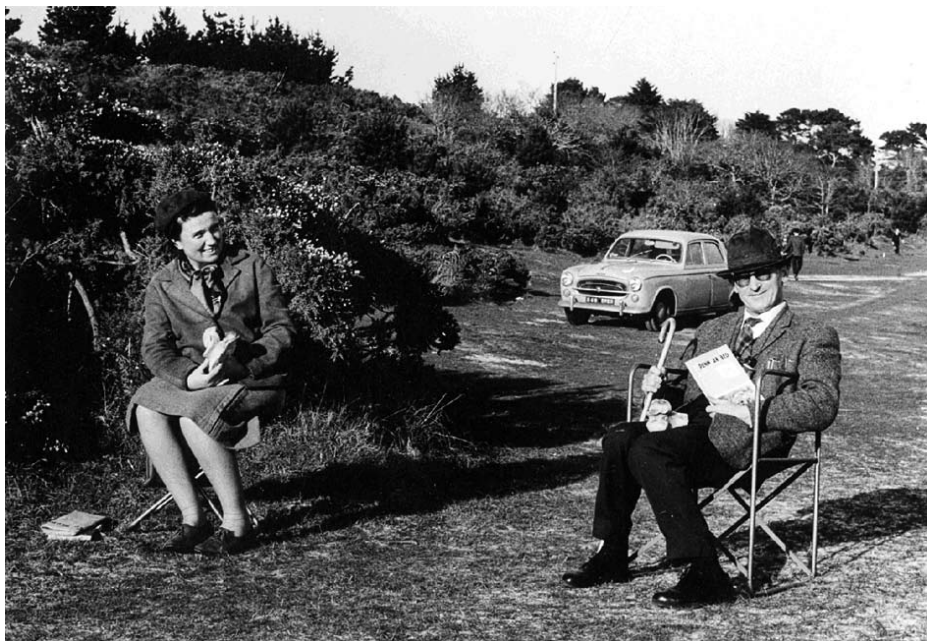
O tiskuiza e fin ar zizun asamblez gand an Itron ... ha peadra da lenn (Penn ar Bed!)

E 1948 e-noa lennet eur pennad « Toponymie nautique des côtes bretonnes » embannet en gand ar Chaloni Falc'hun, kelenner war ar c'heltieg en amzer-ze e Skol-Veur Roazon, ha goude e Brest. Ar pennad-se eo a roas lañs d'e enklaskou hag a oa eur skwer evitañ. Hag eñ o klask bepred gouzoud hirroh e tapas Lan e 1967 an Diplom Uhella Studiou Keltieg e Skol-Veur Vrest. E-barz laboratouer « Phonétique expérimentale », krouet er bloavez 1969, e oa enskrivet, hag ive en « UER des Sciences de la matière et de la mer » a oan rener warni.